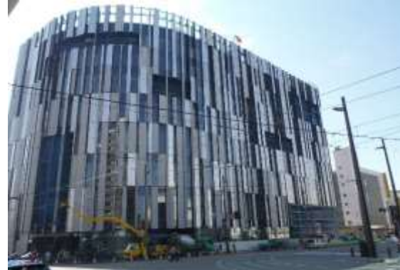
ガラス美術館 (富山市)