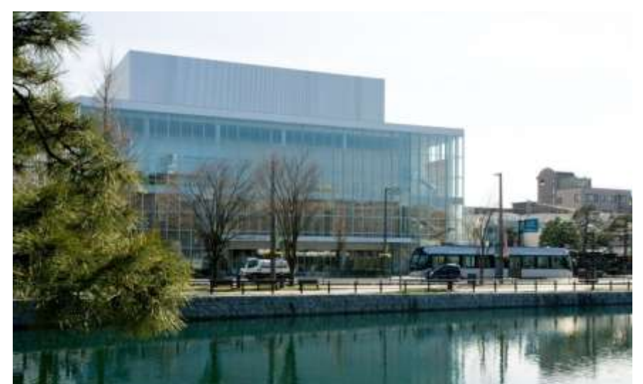
富山城から見た富山国際会議場